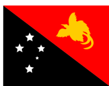
Papúa Nueva Guinea